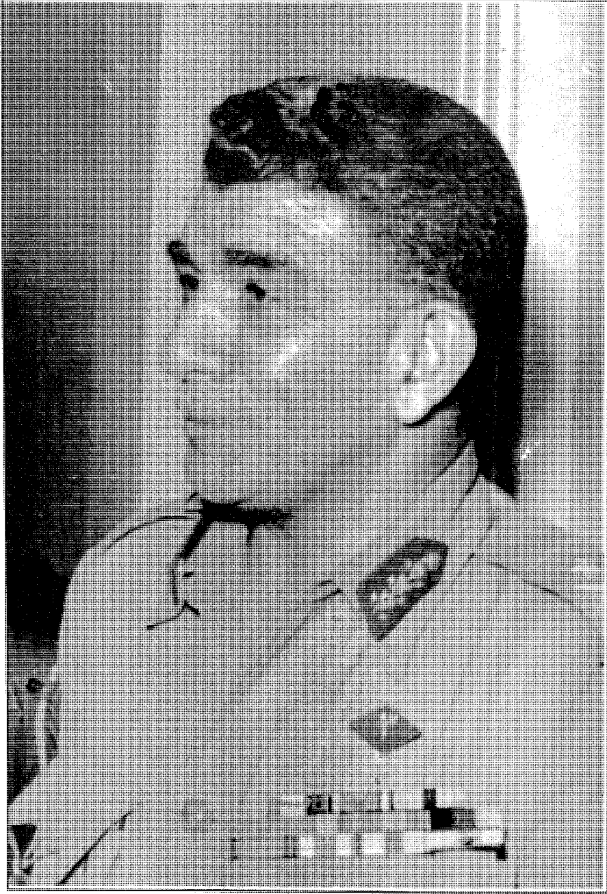
الرئيس محمد نجيب كان لظهوره يوم ٢٢ يوليو تأثير كبير في تأييد الشعب للثورة